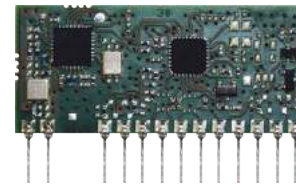
Module could be provided in +3V or +5V version